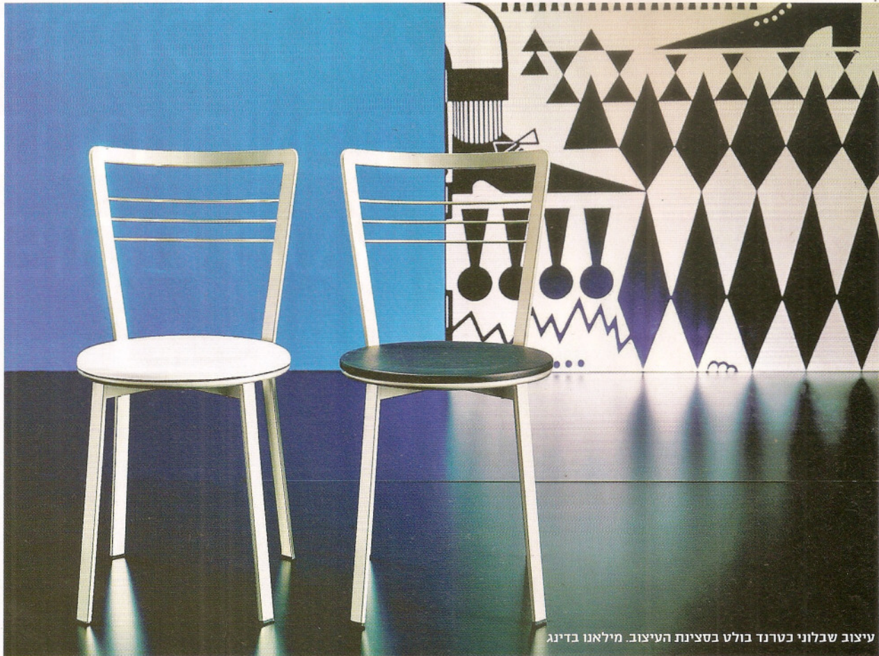
עיצוב שבלוני כטרנד בולט בסצינת העיצוב. מילאנו בדינג

ליצור משחקים גרפיים של קווים מאונכים ומאוזנים, ניתן לשלב בין שני סוגי Pattern ולייצר עניין ויזואלי בחלל ועוד. "עיצוב מבוסס Pattern הוא בחירה קלאסית לחללים עסקיים", אומרים מעצבי חברת אינוביט, "בזכות העובדה שהוא מעורר עניין ובה בעת משרה יציבות והמשכיות אצל המתבונן. אריחי השטיחים מאפשרים חופש פעולה יצירתי וחסר תקדים בזכות הוורטיטיליות ונוחות השימוש המאפיינת אותם, כמו גם המגוון הרחב של התבניות העיצוביות".