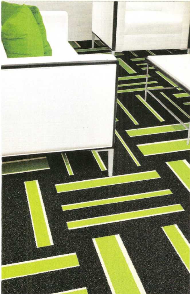
סגנון עיצוב קצבי. אינובייט