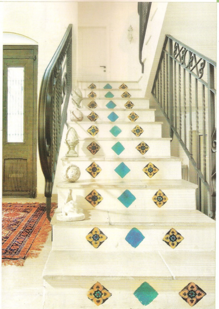
שבלונה כמלאכת יד. טורקזי בית יצחק