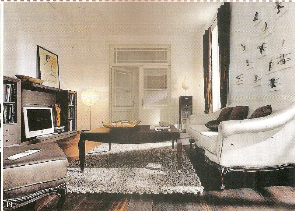
1-3 פנטהאוז רהיטים