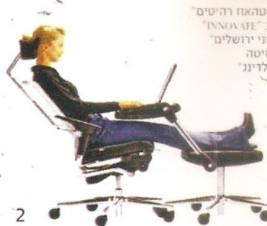
1 - ספרייה וגם מחיצה "פנטהאוז רהיטים" 2 - כסא ונוספת למחשב "INNOVATE" 3 - שידה וכן שולחן "הרמוני ירושלים" 4-5 - ספה מעוצבת וגם מיטה אורטופדית "מילאנו בילדינג"

מחירים מבוגרים שילדיהם עזבו את הבית ורוצים לעבור לבית קטן יותר, אך כזה שיוכל להכיל בנוחות גם את הנכדים שמגיעים לישון ועד אנשים המעוניינים לעבוד מהבית וזקוקים לפינת עבודה מסודרת ומרווחת, אך כזו שלא תגזול שטח יקר מאשר הדירה. ואין ספק שכל אחד מהקוראים יוכל לתרום דוגמאות נוספות, מחייו שלו.