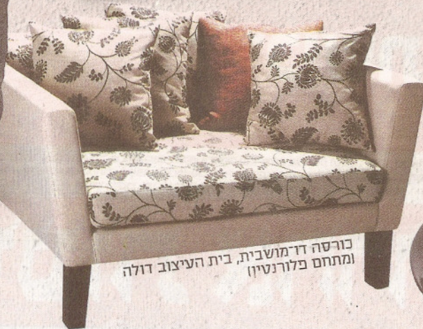
כורסה דד מושבית, בית העיצוב דולה ומתחם פלורנסיין