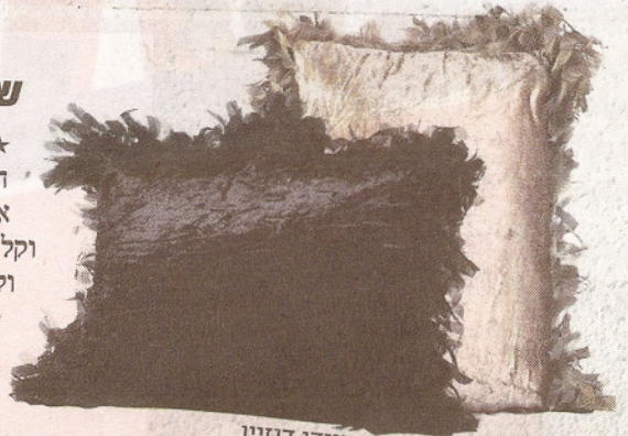
כריות נוי, איי די דיזיין

★ אין חשש שהטרנד הזה ייעלם במהרה, כי מדובר בשילוב קלאסי שתמיד יעמוד במבחן הזמן. אפשר לצרף אליו עוד צבעים מאותה משפחה, כמו חאקי ואפור.