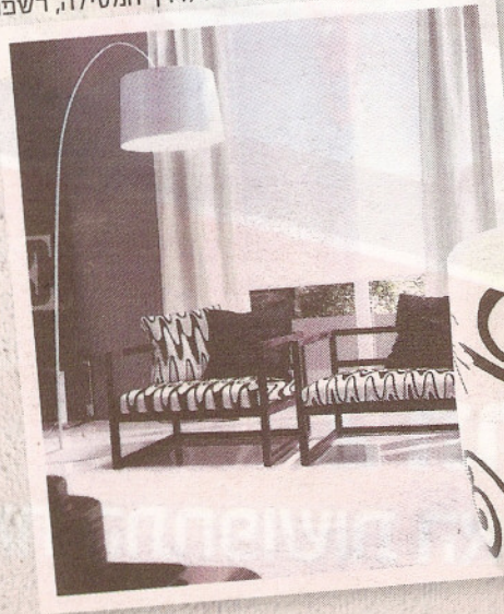
מאג, איי די דיזיין

סלון של מילאנו בדיג ישראל ודרך המסילה, רשפון