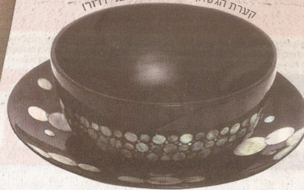
קערת הגשה, טורקזי (מושב בני דרוז)