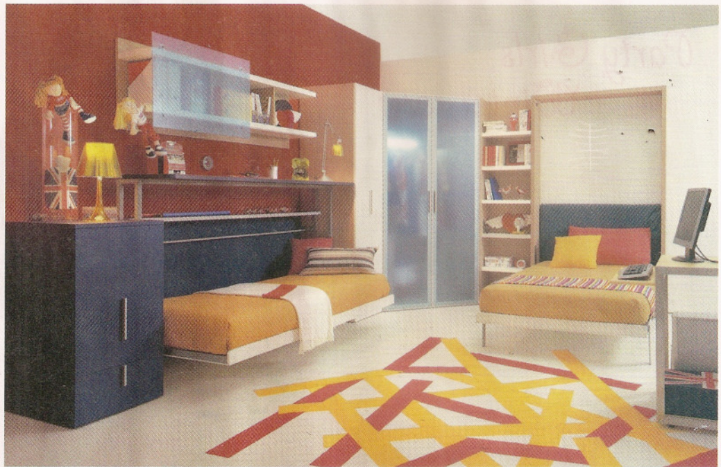
רהיטים דינמיים. הרבה יותר מריהוט סטנדרטי

פתרונות יצירתיים תוכלו למצוא במילאנו בנינג, דרך המסילה רשפון 09-9566833 www.milanobedding.co.il